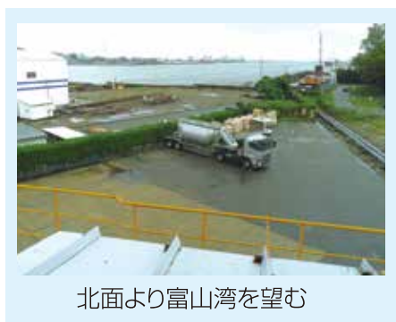
北面より富山湾を望む

調査した構造物は、1957年(約60年前)に稼働を開始したとされる鉄筋コンクリート造のセメントサイロです。富山港に近い場所に位置し、海風等の影響を受ける場所です。