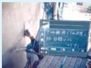
⑤RF防錆ペースト下地調整工程