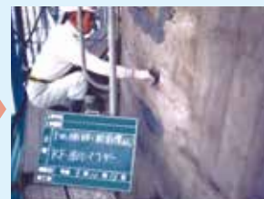
④RF厚付モルタル断面修復工程