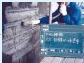
③RF防錆ペースト塗布工程